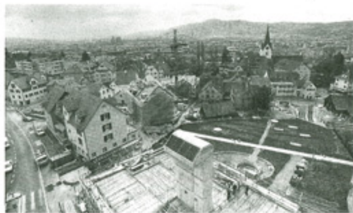
Die Tiefgarage im Bau. Vorne: der im Dach-integrierte Abluftkamin. Auf der Schärerwiese sind die Fundamentarbeiten und die Humusierung abgeschlossen. Wenig ist dem Zufall überlassen.

The hedges form smaller and larger areas for play and for "taking a constitutional", and intermediate areas between buildings without taking away their sun. The