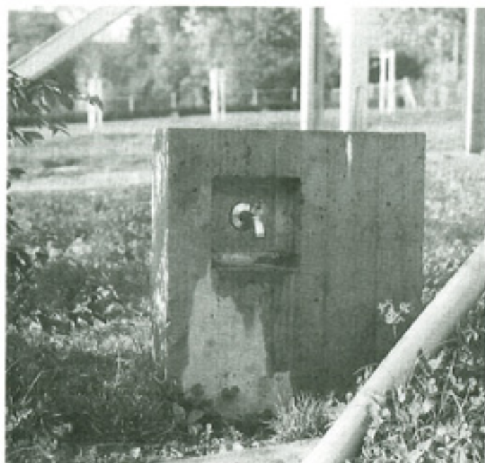
Links: Die einzelnen Elemente sind roh, in ihrer dichten Anordnung machen sie die Anlage üppig. Foto: Jeger Rechts: Beton und Metall werden bei liebevoller Verwendung lebendig wie wuchernde Kräuter. Foto: Jeger