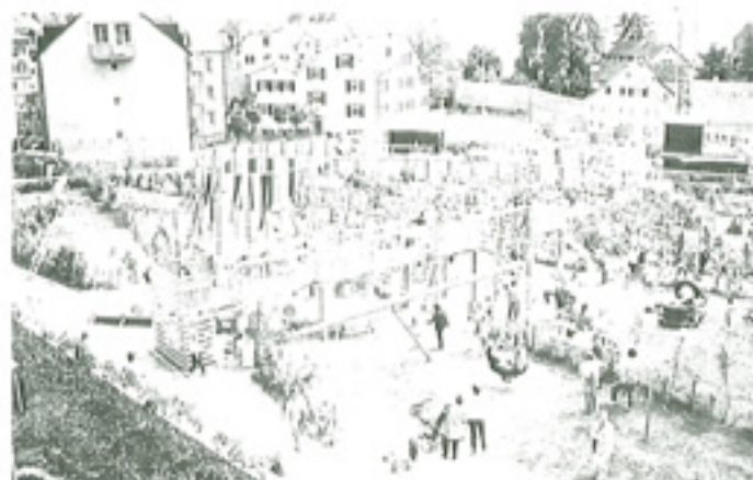
Wenn jede Struktur in ihrer eigenen Form und auf ihre Umgebung hin abgewogen ist, können sie –ungeschönt– aufeinanderprallen.

The underground car park under construction. Foreground: the ventilation shaft "integrated" in the roof. On the Schärerwiese the foundation works and the spreading of humus have been completed. Little has been left to chance.