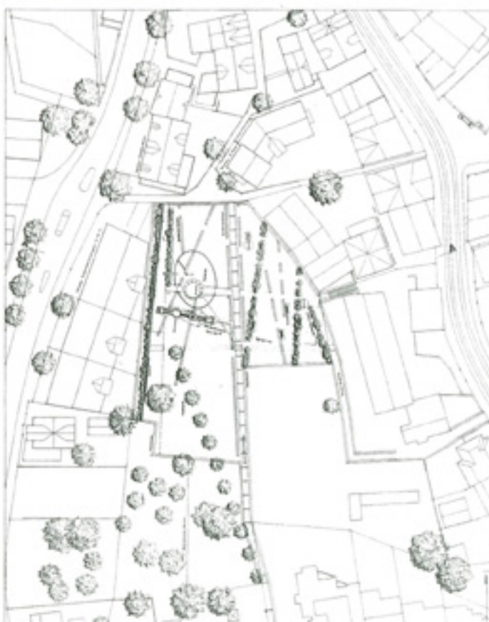
Die beliebige Anordnung der Elemente ist Chaos und Konstruktion zugleich. Ausdruck der «verkehrt» Welt. Projekt – Grundriss und Schnitt.

L'agencement aléatoire des éléments est chaos et construction à la fois: expression d'un monde «dé-tourné». Projet – plan et coupe.